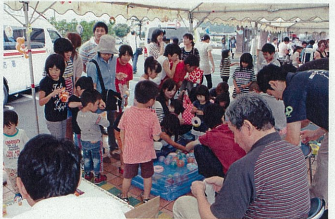
⑥縁日コーナー（子どもは無料）