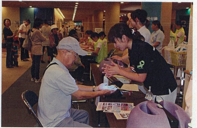
④手洗いチェック（奥はハンドマッサージ）